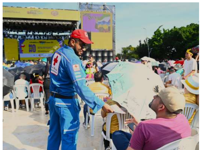
Voluntario Juvenil entregando volantes con recomendaciones.