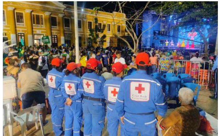
Nuestros voluntarios presentes en la Noche del Río.