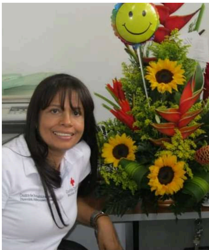
Estuvo vinculada como apoyo al área administrativa.

“No me esperaba la despedida que me hicieron. Me sentí honrada, valorada y amada por mis compañeros. Sentí que cada año y acción por los demás valió totalmente la pena y pude irme con mi corazón en paz y la satisfacción del deber cumplido”, señaló.