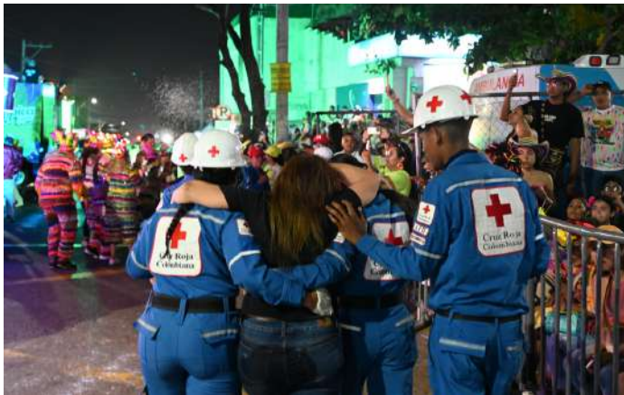
Voluntarios auxiliando a asistente de la noche de Guacherna.