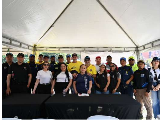
Autoridades distritales y organismos de socorro presentes en el puesto de mando unificado.

Con este tipo de acciones la institución buscó fomentar la sana convivencia y promover el cuidado a la salud durante esta época carnestoléndica, y así reducir los riesgos que pudieran presentarse, demostrando una vez más que la prevención y la colaboración de todos los involucrados fueron factores claves para garantizar el éxito del evento.