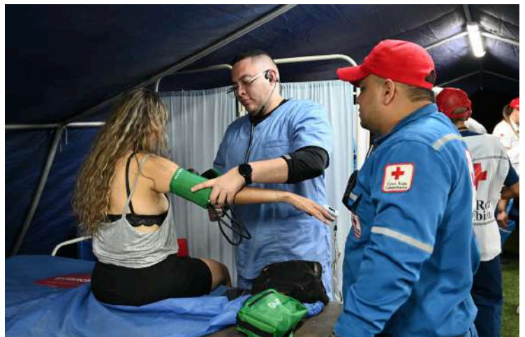
Verificación de presión arterial a una espectadora del evento.