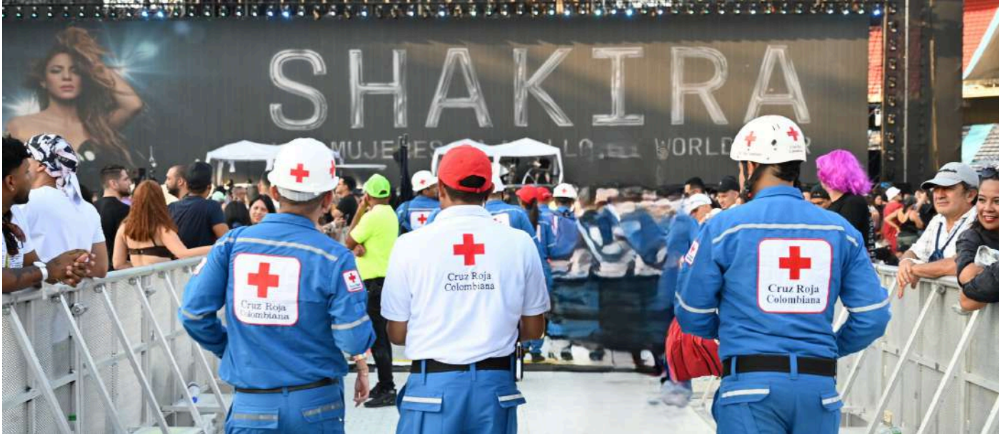
Durante los 7 días de montaje y desmontaje, se brindó atención a un total de 190 personas que formaban parte del equipo logístico.

Para este evento se requirió la participación de un total de 180 personas, entre trabajadores y voluntarios de la Seccional, quienes colaboraron en la cobertura del concierto durante sus dos fechas