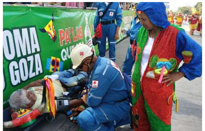
Atención durante la Gran Parada de Tradición.