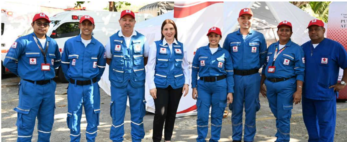
Colaboradores y voluntarios junto a la Directora Ejecutiva de la Seccional presentaron las capacidades institucionales.

Con servicio médico, capacitaciones y ambulancias, los colaboradores se alistan para atender con eficacia las celebraciones de carnaval. Algunos de ellos detallaron el sacrificio que su labor conlleva.