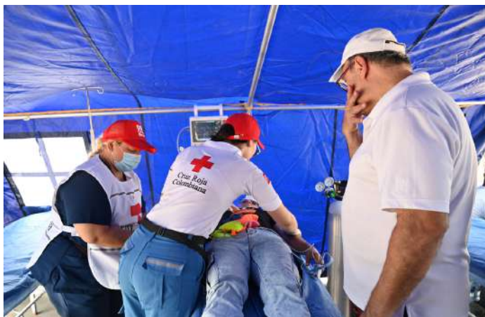
Atención a paciente durante la Batalla de Flores.