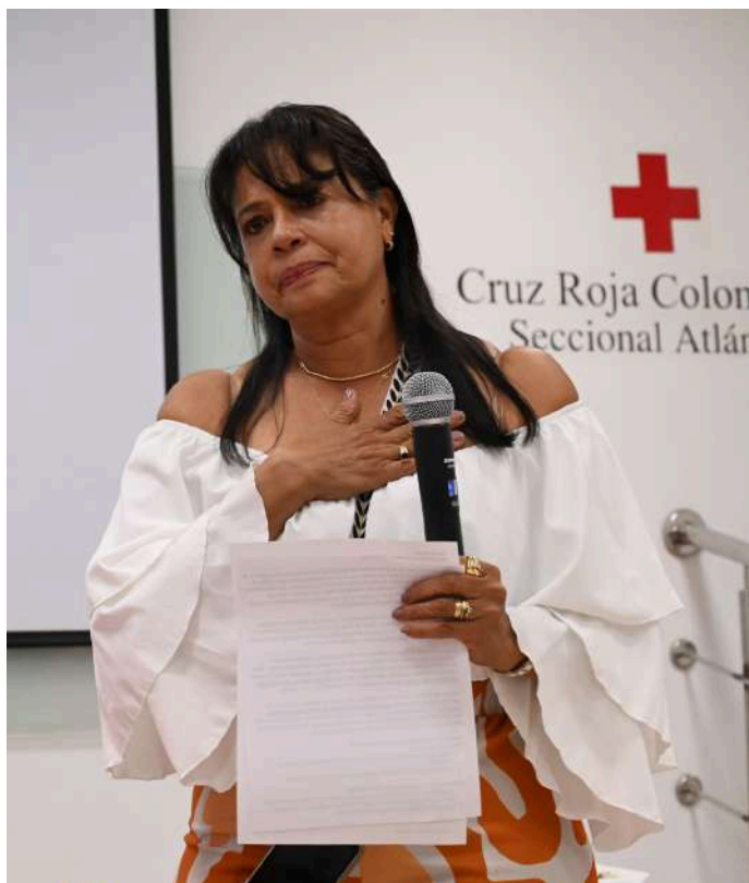
'Maga' en su último día de trabajo y despedida.