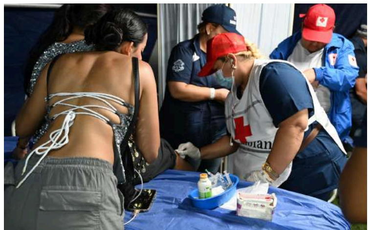
Medico voluntaria proporcionando atención inmediata.

Durante las dos fechas de la cantautora barranquillera se contó con el apoyo de 180 voluntarios, colaboradores y personal de la salud en las labores de atención realizadas en diferentes puntos del estadio Metropolitano y en el MEC.