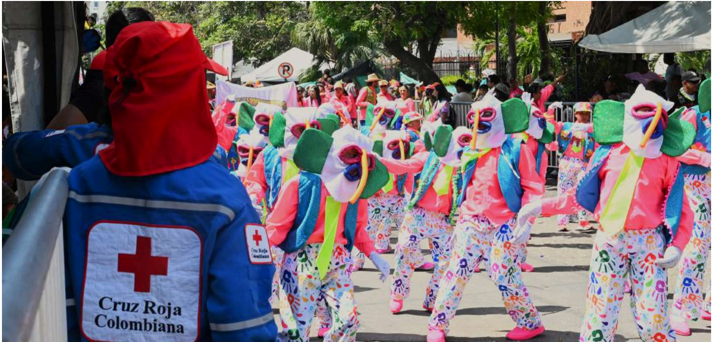
Voluntaria atenta para ayudar a los asistentes del evento, durante el desfile de los Niños en la carrera 53.

38 jóvenes y niños fueron atendidos durante la Coronación de Reyes Infantiles y el desfile de los niños 2025.