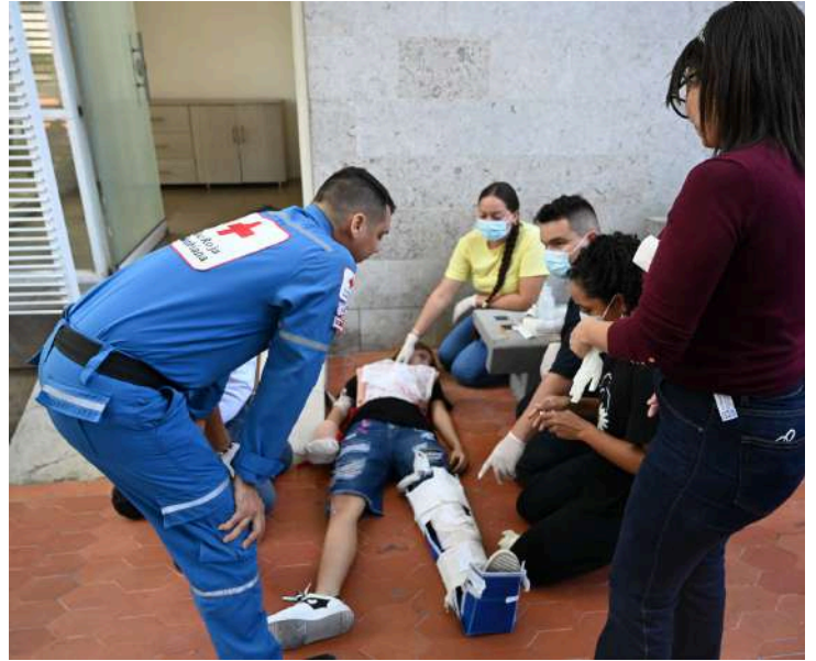
Estudiantes del Instituto aprendiendo de forma dinámica durante sus clases teórico prácticas.

POR SHARON HERRERA DÍAZ