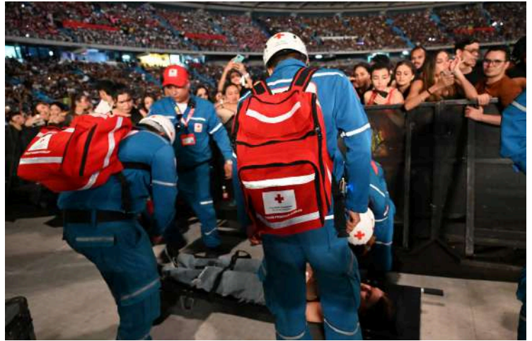
Servicio asistencial en la zona VIP del concierto.