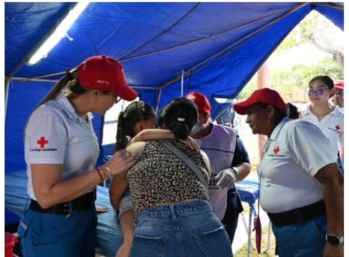
Personal del MEC realizan atención a una menor.