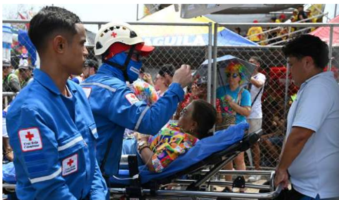
Voluntarios realizan traslado de paciente en ambulancia.

POR SHARON HERRERA DÍAZ