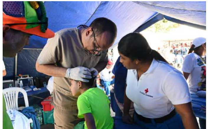
Revisión a paciente durante el carnaval de los Niños.