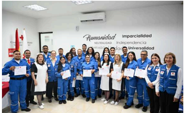
Nuevos voluntarios y miembros de junta durante la ceremonia de consagración.

También, extendió una invitación en nombre de las tres agrupaciones para que más personas se unan al voluntariado de la Cruz Roja. “Su energía y pasión son esenciales para continuar creciendo y haciendo una diferencia significativa en nuestras comunidades. Únanse a nosotros y sean parte de este increíble movimiento”.